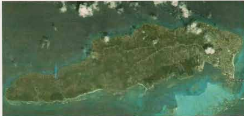
Una planta Otec híbrida (ciclo abierto y cerrado) para dar agua potable y electricidad para "La Isla de San Andrés"

experimentos en el laboratorio de energía natural de Hawai a comienzos de 1980 en el cual él generó apropiadamente gólicas de niebla bien dimensionadas y demostró que el vapor a un par de gólicas fue como sus cálculos predijeron. Un trabajo más pequeño ha sido preformado sobre este proceso.